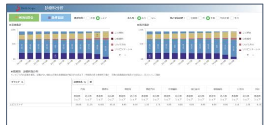
「診療科分析」で病院での使用実態を把握